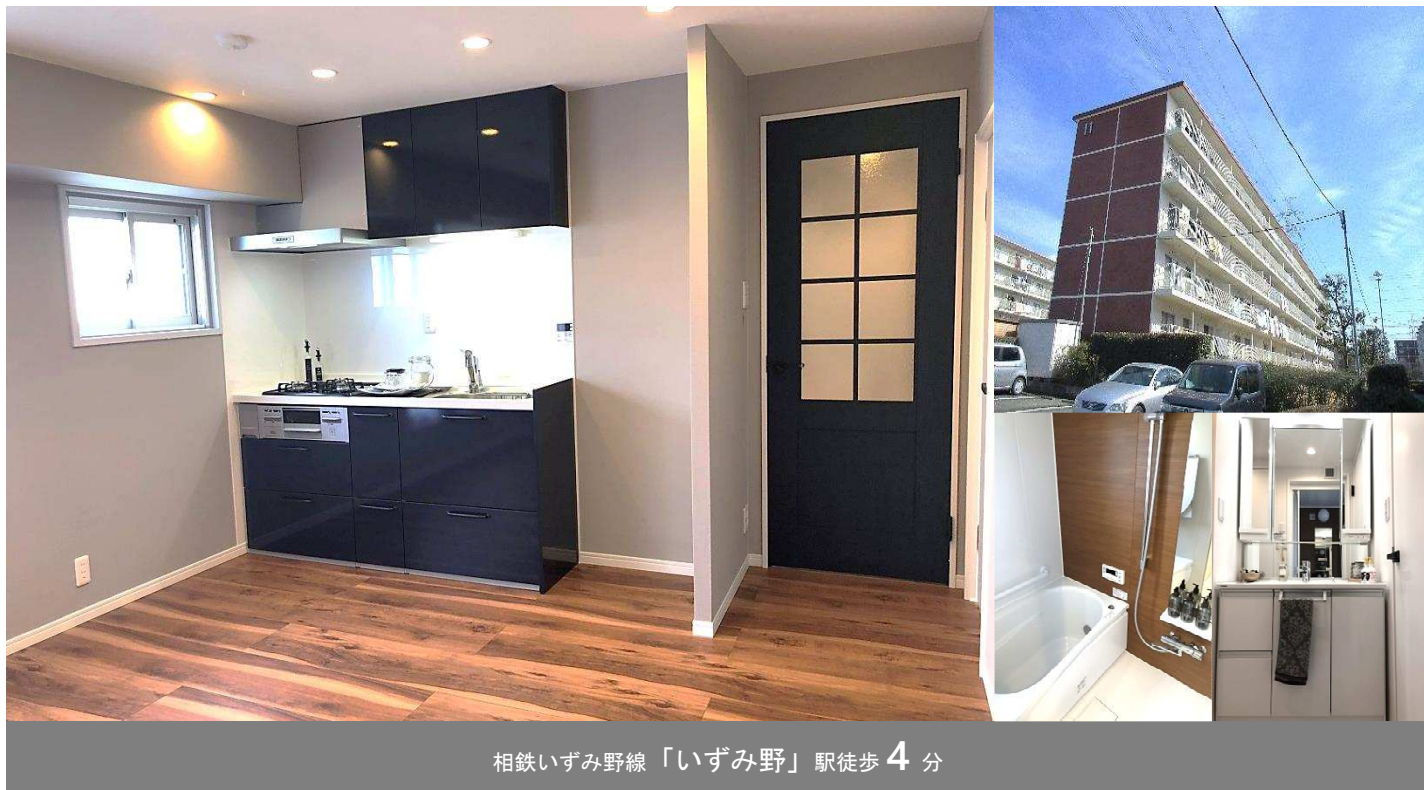
相鉄いずみ野線「いずみ野」駅徒歩4分