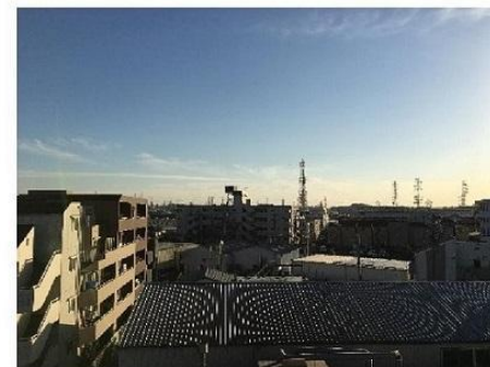
※5階バルコニーからの眺望