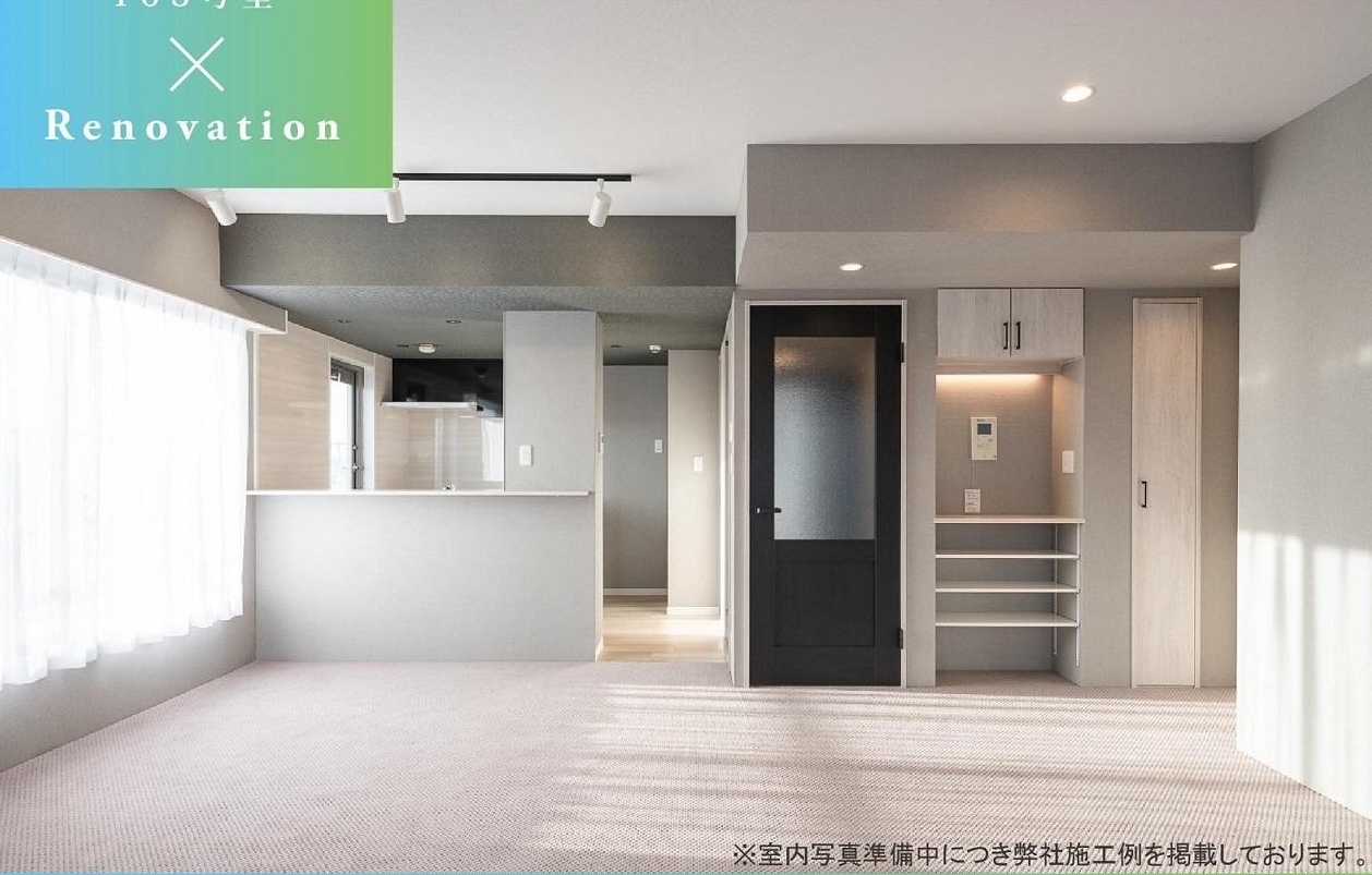
※室内写真準備中につき弊社施工例を掲載しております。